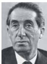
Георгий Козинцев, режиссер