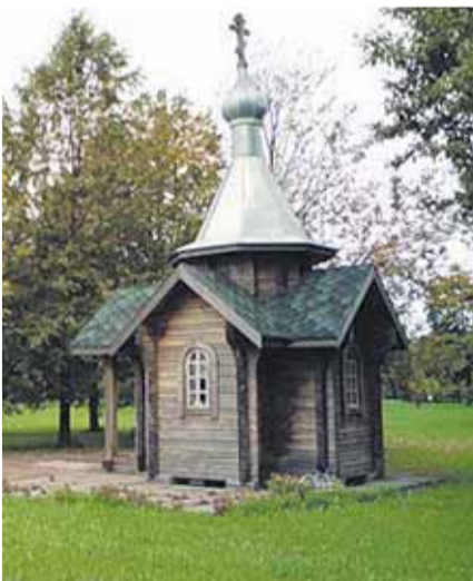
Временная часовня у Пискаревского кладбища