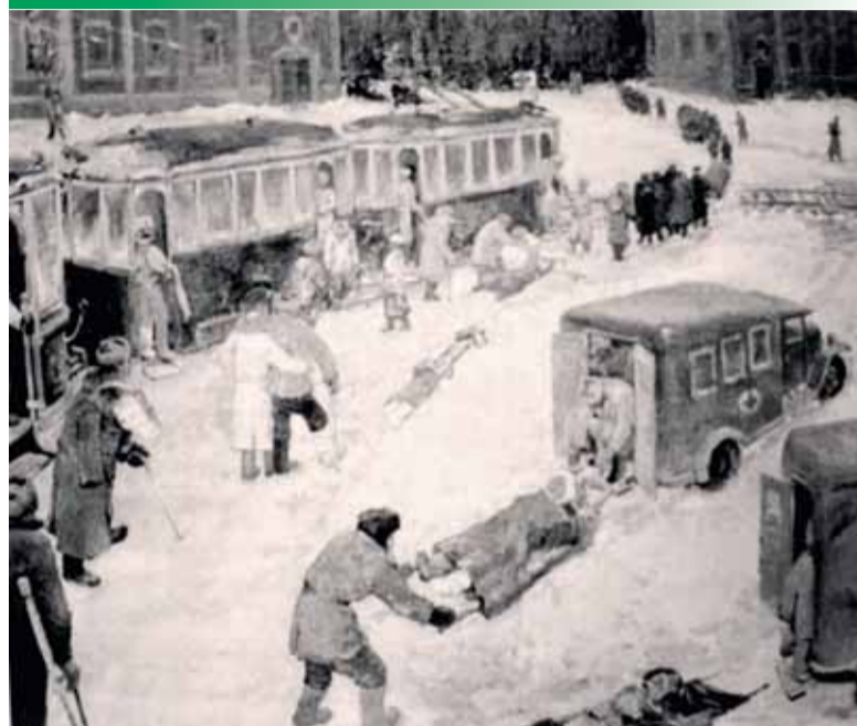
Доставка раненых в больницу. Зима 1941–1942 годов. Фото с картины художника Митрофанова

В городе остановилось трамвайное движение, сотрудникам и студентам приходилось добираться до больницы пешком, преодолевая по 12–15 км в один день. Среди медицинского персонала повысилась заболеваемость дистрофией. В связи с этим 8 ноября 1941 года в больнице был издан приказ о получении бесплатного питания дежурным персоналом лечебных павильонов. На отделениях были выделены помещения для проживания сотрудников, обслуживающих оперативные койки. Вы-