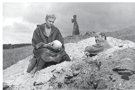
Иннокентий Смоктуновский в роли Гамлета

Пересматривая «Гамлета» в наши дни, понимая, как он был ко времени в 1960-е годы (со всеми своими смыслами и подтекстами), отмечаешь и многое